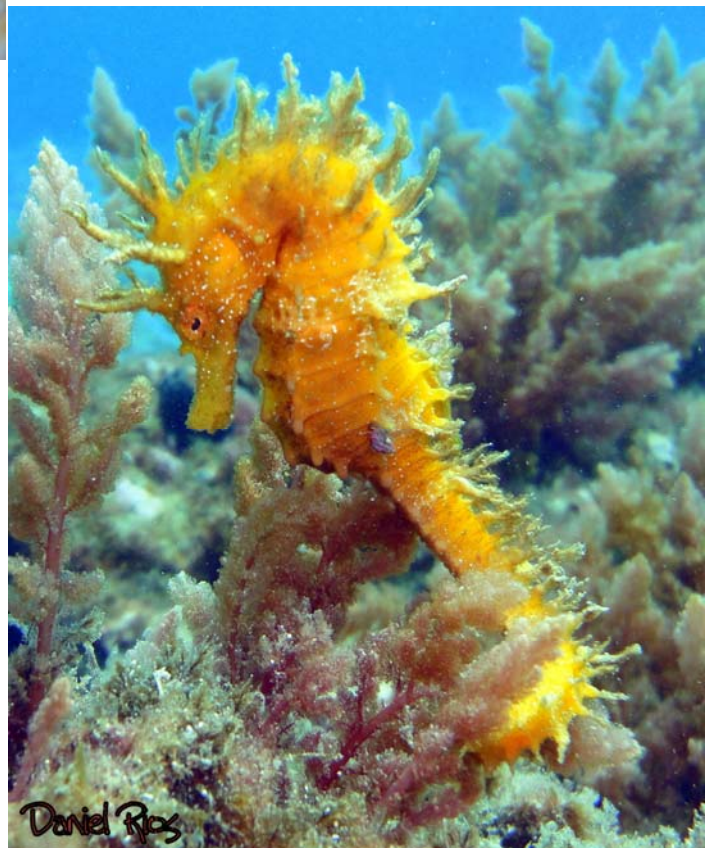
Premio Interés Biológico: "Caballito" Autor: Daniel Ríos