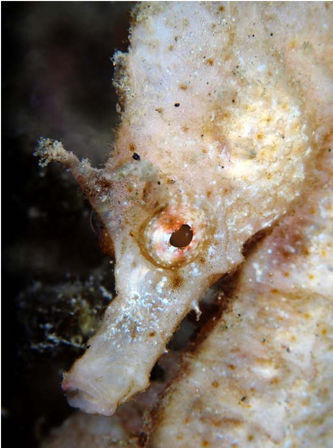
3er. Premio "Hipo-Hipo" Autor: Antonio Martín Rodríguez