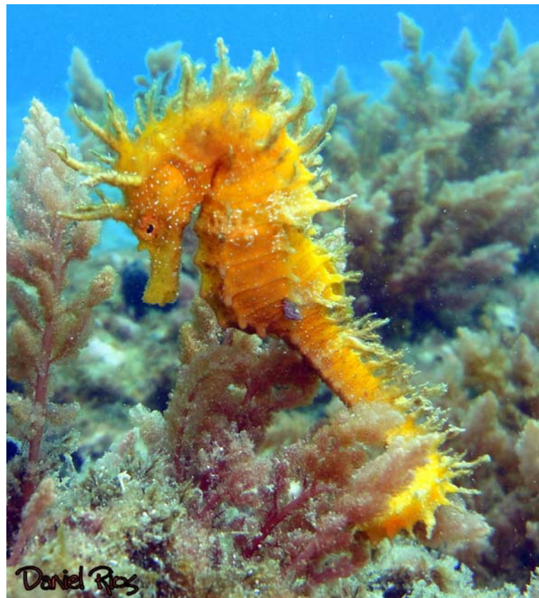
2º Premio "Caballito" Autor: Daniel Ríos