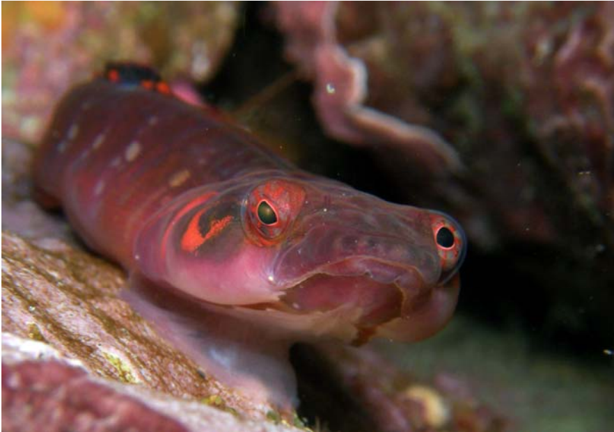
1er Premio "Mirada" Autor: Fabián Álvarez